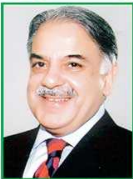
وزیر اعلیٰ پنجاب میاں محمد شہباز شریف