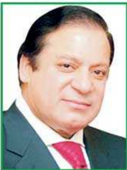
وزیر اعظم پاکستان میاں محمد نواز شریف